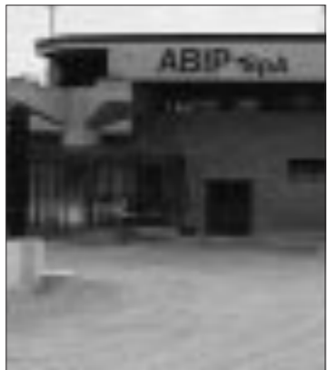
La sede Abip di Torbole

La conceria di Torbole Casaglia (106 addetti) chiude l'esercizio con ricavi stabili a 8,6 milioni